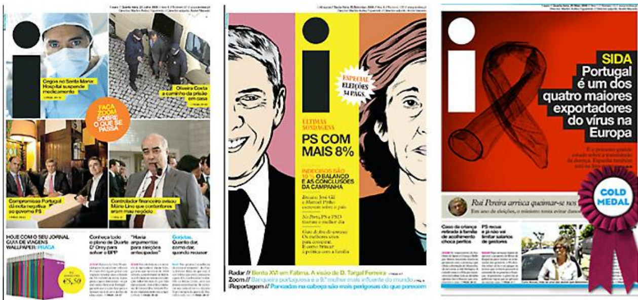
Рисунок 1 – Газета I

і вполне успешно растит тиражи – стартовал с 40 000, Мартим Фигуэйро перешагнул отметку 65 000 экз. Онлайн-продукт - Ошибка! Недопустимый объект гиперссылки.- создается тем же ньюсрумом и теми же журналистами, которые делают газету, в процессе работы над бумажным номером. Мартим Фигуэйро не расставляет приоритетов – какой носитель важнее для него как редактора. Журналист «в теме», и он сам разберется – что важнее «выкатить» на сайт, получить реакцию читателей, скорректировать будущую заметку для бумажной газеты.